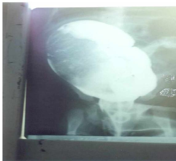
شکل 2: ب

شکل 2: الف و ب - باریم انما در بیمار معرفی شده مبتلا به هیرشپروننگ قسمت بدون گانگلیون دیستال تنگ و قسمت پروگزیمال دارای گانگلیون شدیداً گشاد شده است.