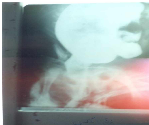
شکل 2: الف

نتیجه گیری: ما در مقاله بیماری هیرشپروننگ همراه با نقص بین بطنی (VSD)، آترزی پولمونر (PUL.Atresia) و کانال شریانی باز (PDA) را گزارش دادیم و با بررسی منابع در دسترس، مدلاین کلاسیک، شبکه اینترنت نتوانستیم چنین موردی را بیابیم، بنابراین تصمیم به گزارش آن نمودیم.