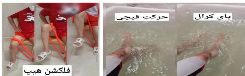
شکل ۲: نمونه‌ای از تمرینات گروه تمرین با تراباند و تمرین در آب