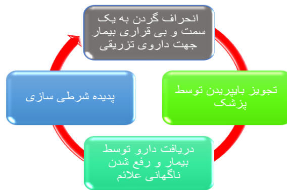
نمودار ۱: شرطی سازی و تقویت مثبت دریافت دارو

سدیم والپروات (۵۰۰ میلی‌گرم هر ۱۲ ساعت)، لیتیم کربنات (۳۰۰ میلی‌گرم هر ۱۲ ساعت)، تیوریدازین (۲۵ میلی‌گرم هر شب) و مدروکسی پروژسترون استات ۵ میلی‌گرم (روزی