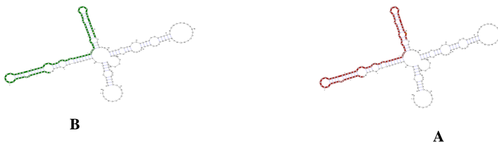
شکل ۳: تغییرات ساختار فضایی ناشی از چندشکلی rs12602273 ژن

* T1≤2cm, T2: 2-5cm, T3> 5cm, ** N0: 0, N1: 1-3cm, N2: 4-9cm, N3≥ 10cm