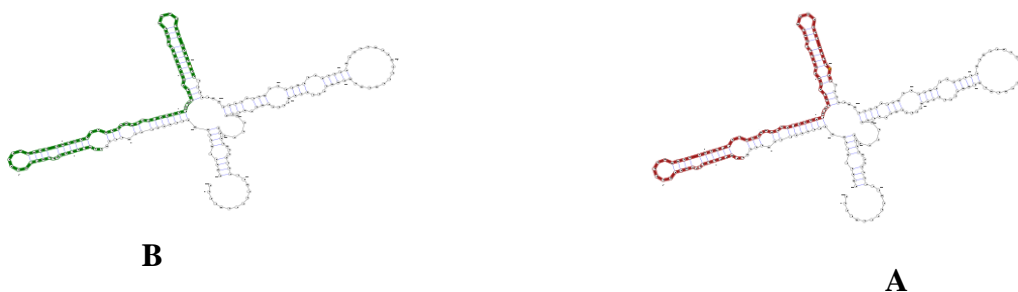
شکل ۳: تغییرات ساختار فضایی ناشی از چندشکلی rs12602273 ژن

* T1≤ 2cm, T2: 2-5cm, T3> 5cm, ** N0: 0, N1: 1-3cm, N2: 4-9cm, N3≥ 10cm