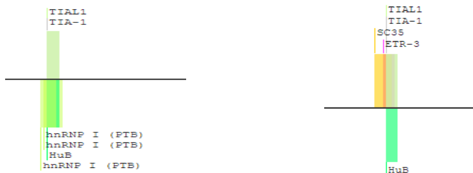
شکل ۴: آنالیز چندشکلی ژن TP53 توسط نرم‌افزار آنلاین Splice Aid2 A: عدم اتصال دو پروتئین SC35 و ETR-3؛ B: اتصال دو پروتئین SC35 و ETR-3.