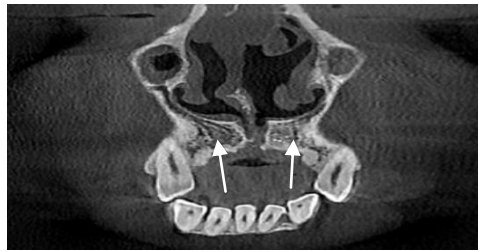
شکل ۲: در نمای CBCT کات کرونال، کانال CS که از ۲ سمت نازل فوسا به سمت قدام ریج آلوئول گسترش یافته (فلش‌ها)