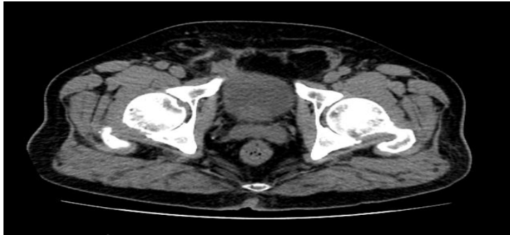
تصویر ۱: هرنی مثانه به داخل کانال اینگوئینال در سی تی اسکن