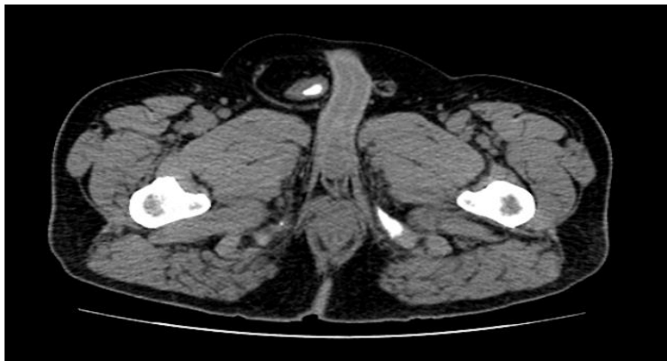
تصویر ۲: یک سنگ در هرنی مثانه به اسکروتوم در سی تی اسکن