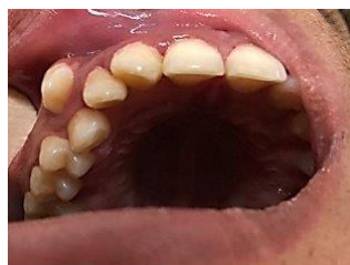
شکل ۲: تصویر فوتوگرافی داخل دهانی با نمای اکلوزال که موقعیت دندان کانین اصلی را در سمت با کال قوس فک بالا نشان می‌دهد.