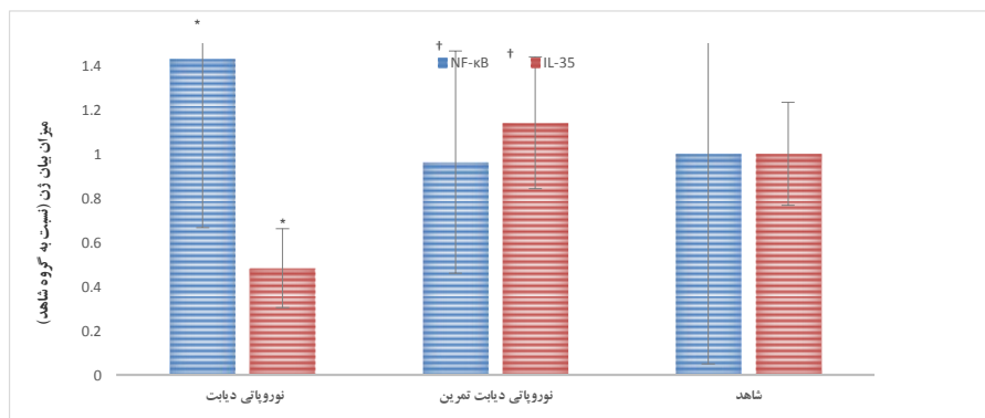
نمودار ۳: میزان بیان ژن NF-kB و IL-35 در بخش خلفی نخاع گروه‌های مختلف. * اختلاف معنی‌دار با گروه شاهد ( P < 0.05 ). † اختلاف معنی‌دار با گروه نوروپاتی دیابتی ( P < 0.05 ).