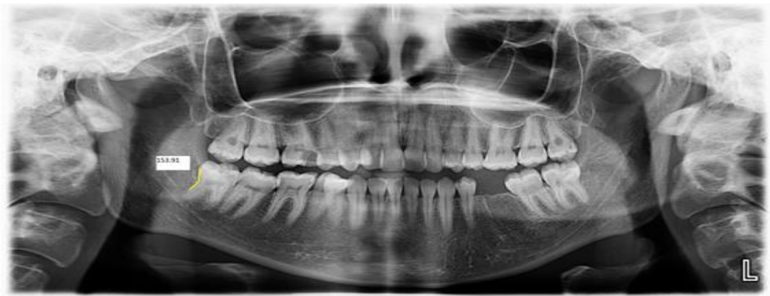
شکل ۱: اندازه‌گیری زاویه بین تاج و ریشه دندان مولر سمت راست مندیبل در رادیوگرافی پانورامیک با استفاده از نرم‌افزار Romexis Viewer (خطوط رسم شده با رنگ سبز در دیستال دندان مولر سوم مشهود است)