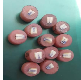
شکل ۳: نمونه‌های مانت شده جهت انجام تست میکروهاردنس

جدول ۱: تعیین و مقایسه میانگین نمره microhardness در گروه‌های ۲و۱