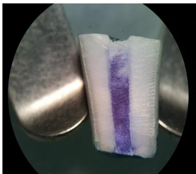
شکل ۲: بررسی نشست رنگ در نمونه‌های گروه ۱ با استریومیکروسکوپ با بزرگنمایی ۱۵×

برای بررسی سختی از تست میکروهاردنس با دستگاه ویکرز استفاده شد. میانگین سختی در گروه ۱، ۵۴/۲۲ و در گروه ۲، ۴۱/۲۰ گزارش شد. میزان اختلاف سختی دو گروه از نظر آماری معنادار بود ( P < 0/001 ). حداکثر و حداقل میزان سختی در گروه ۱ به ترتیب، ۷۳/۲۰ و ۳۱/۲ و در گروه ۲ به ترتیب، ۵۵/۵۰ و ۲۹/۸ بود (جدول ۱). برای بررسی میزان ریز نشست از روش نفوذ رنگ استفاده شد. میزان نفوذ رنگ بر حسب میلی متر در گروه‌های مختلف ثبت و با یکدیگر مقایسه گردید. نتایج حاصل از تجزیه و تحلیل اطلاعات به دست آمده از این پژوهش نشان می‌دهند که میانگین نمره ریز نشست پس از سه روز در گروه ۱، ۰/۹۷۳۹ میلی متر و در گروه ۲، ۰/۱۳۹۱ میلی متر بود. حداقل میزان نشست رنگ در گروه ۱ و ۲، صفر و حداکثر میزان نشست رنگ در گروه ۱، ۵ میلی متر و در گروه ۲، ۱/۸ میلی متر بود. اختلاف آماری معناداری بین میانگین میزان نفوذ رنگ بعد از ۳ روز در دو گروه دیده شد ( P < 0/05 ). (جدول ۲). در گروه کنترل مثبت رنگ به طور کامل در طول بلوک‌های عاجی نفوذ کرده بود و در گروه کنترل منفی هیچ نفوذ رنگی در بلوک‌ها دیده نشد، که نشانگر صحت روش انجام مطالعه می‌باشد.