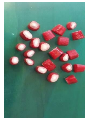
شکل ۱: بلوک‌های عاجی بعد از زدن دو لایه لاک