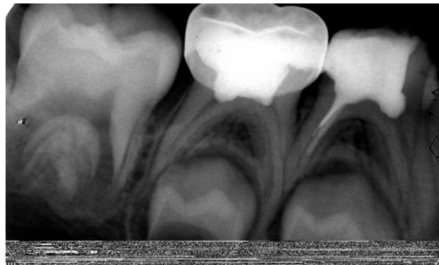
تصویر ب- یک سال پس از درمان پالپوتومی دندان مولر دوم شیری به روش سولفات فریک با استفاده از ساب بیس زینک پلی کربوسیلیات. نگاره پری آپیکال طبیعی به نظر می رسد.