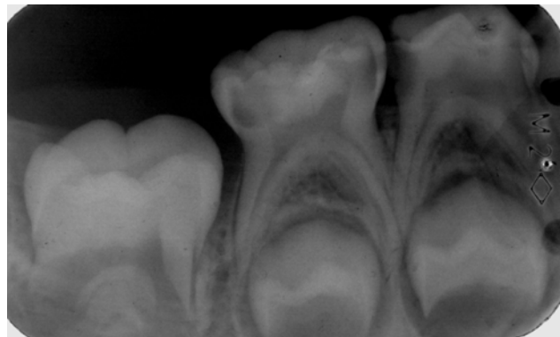
تصویر الف: پالپ مولر دوم شیری متعاقب بروز پوسیدگی اکسپوز شده و دندان کاندید درمان پالپوتومی در نظر گرفته شده است.