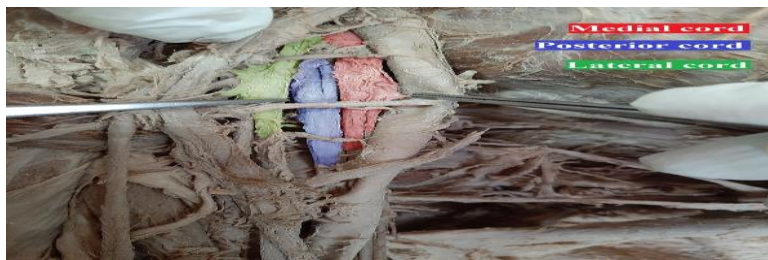
شکل ۱: موقعیت طناب‌های داخلی، خلفی و خارجی

در هنگام تشریح جسد یک مرد حدوداً ۵۴ ساله در سالن تشریح دانشکده پزشکی دانشگاه علوم پزشکی شهید صدوقی یزد حین آموزش درس اندام فوقانی برای دانشجویان ارشد علوم تشریح، یک واریاسیون نادر در انشعابات عصبی طناب خارجی دیده شد. هنگام تشریح ناحیه آگزिला سمت راست جهت بررسی اعصاب جدا شده از طناب‌های عصبی، مشاهده گردید که عصب مدیال پکتورال از طناب داخلی جدا نشده است و این عصب همراه با عصب لترال پکتورال از طناب خارجی جدا شده‌اند. یعنی در طناب خارجی که در حالت معمول سه انشعاب عصبی دارد، چهار انشعاب دیده می‌شود. هم‌چنین در طناب داخلی چهار عصب دیده شد. در انشعابات عصبی دیگر و مجاورت طناب‌های عصبی واریاسیونی مشاهده نشد.