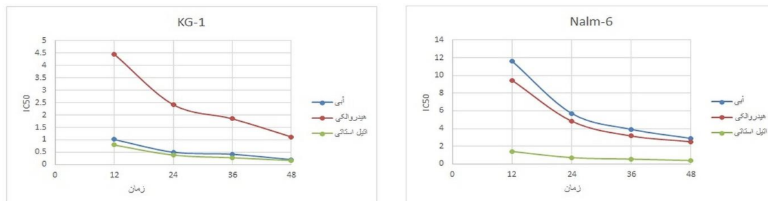
شکل ۱: میزان IC_{50} عصاره‌های آبی، هیدروالکلی و اتیل استاتی برای رده‌های سلولی KG-1 و Nalm-6 در زمان‌های ۱۲، ۲۴، ۳۶ و ۴۸ ساعت

پروپوزال این تحقیق توسط دانشگاه علوم پزشکی تهران تأیید شد (کد اخلاق: IR.TUMS.SPH.RCE.1395.1342).