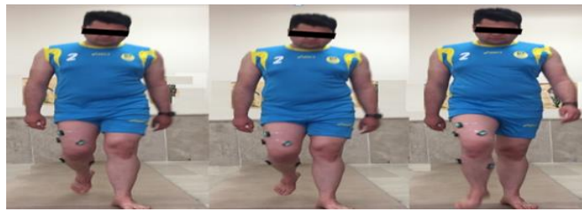
شکل ۱: محل نصب الکترودها

دو گروه استفاده شد. جهت محاسبه اندازه اثر (d) از رابطه زیر استفاده شد (۲۰):