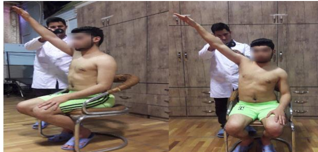
شکل ۲: از راست به چپ اندازه‌گیری دامنه حرکتی آبداکشن و فلکشن مفصل شانه

که میانگین سه تکرار به عنوان زاویه فلکشن ثبت گردید. برای اندازه‌گیری چرخش داخلی و چرخش خارجی در حالی که آزمودنی بازوی برتر را ۹۰ درجه آبداکشن و آرنج را در ۹۰ درجه فلکشن قرار داده بود، اینکلاینومتر پشت ساعد آزمودنی قرار می‌گرفت در ادامه از وی خواسته شد تا بدون حرکت اضافه یا فلکشن، اکستنشن ستون فقرات یا گردن با نگاه کردن به جلو