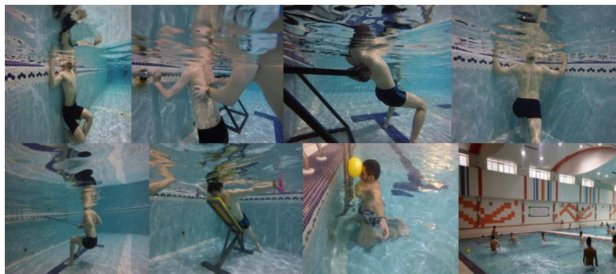
شکل ۳: نمونه‌ای از تمرینات اصلاحی انجام شده در آب

یک روز بعد از اتمام تمرینات اصلاحی در آب، پس از آزمون در هر دو گروه تجربی و کنترل مطابق پیش آزمون انجام شد.