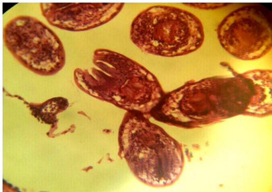
شکل ۲: نمای میکروسکوپی نمونه پاتولوژی بافت کلیه که حضور اسکولوس را در مایع کیست نشان می دهد .

بود. بافت‌هایی که به ندرت به کیست هیداتیک مبتلا می‌شوند شامل کلیه، پانکراس و پستان است (۷،۸). علایم کلینیکی شایع در کیست هیداتیک، هماچوری، درد پهلوها و به ندرت گلومرولونفریت و آمیلوئیدوز است (۹). در اکثر موارد این کیست به صورت اتفاقی در گرافی‌هایی که به دلایل دیگر انجام می‌شود، کشف می‌گردد. اندازه کیست‌ها در عرض یکسال ۱ تا ۳ سانتیمتر و گاهی حتی به طول ۱۰ سانتیمتر هم رشد می‌کنند و پس از آن سال‌های زیادی در بافت‌های بدن زنده می‌ماند (۱۰). برای تشخیص قطعی این ضایعه از معاینات کلینیکی دقیق، تست‌های آزمایشگاهی (سرولوژیک)، رادیوگرافی (سونوگرافی، سی تی اسکن و ام آر آی) و هیستوپاتولوژی استفاده می‌شود. علایم رادیولوژیک و سرولوژیک در این ضایعه غیراختصاصی است و تشخیص نهایی ضایعه با بررسی میکروسکوپی بافت، پس از عمل جراحی امکان‌پذیر است (۳،۴). در این بیمار، تست‌های آزمایشگاهی نرمال بود. ارزیابی‌های سرولوژیک و گرافی نقش مهمی در تشخیص افتراقی هیداتیدوز