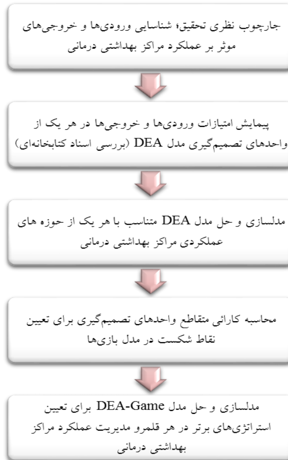
شکل ۱: فرآیند تحقیق

حوزه های؛ بهداشت خانواده، بهداشت مدارس، پیش گیری و مبارزه با بیماری ها، پزشکی، بهداشت دهان و دندان، آموزش و سلامت و بهداشت محیط شناسایی و مورد تحلیل قرار گرفت. شکل ۱ چارچوب فرآیند پژوهش را نشان می دهد