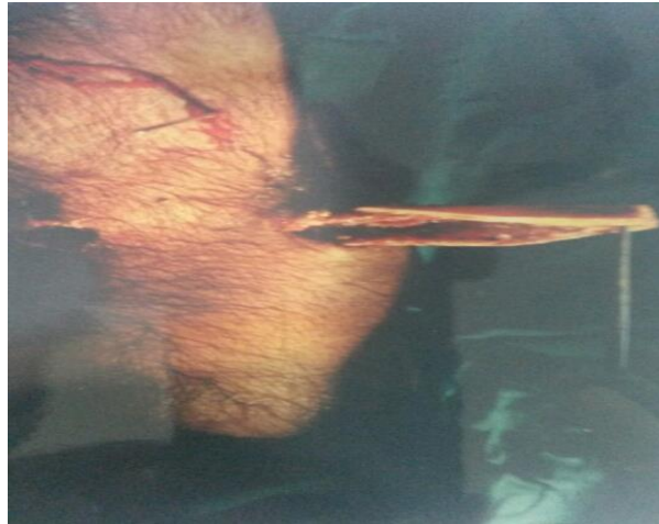
شکل ۱: جسم خارجی زانوی چپ