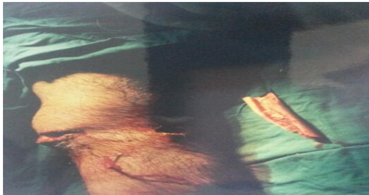
شکل ۳: جسم خارجی پس از خروج از زانو

استخوان موجود در زانوی بیمار متعلق به طرف دوم تصادف که فوت شده می‌باشد. در پیگیری از پزشکی قانونی وجود شکستگی باز با زخم وسیع و نقیصه استخوانی در ران چپ متوفی تأیید شد.