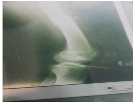
شکل ۲: رادیوگرافی شکستگی ران و جسم خارجی زانو