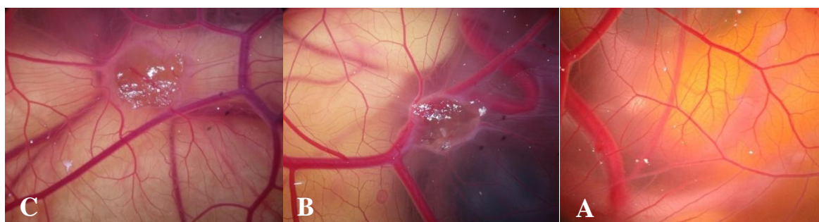
شکل ۲: نمونه‌های تحت تیمار با عصاره آبی ریحان که بیشترین بیان ژن را نشان دادند. A: نمونه شاهد (بدون تیمار)، B: نمونه تیمار با عصاره آبی دوز ۵۰، C: نمونه تیمار با عصاره آبی دوز ۱۵۰. افزایش طول و تعداد عروق خونی مشاهده می‌شود.