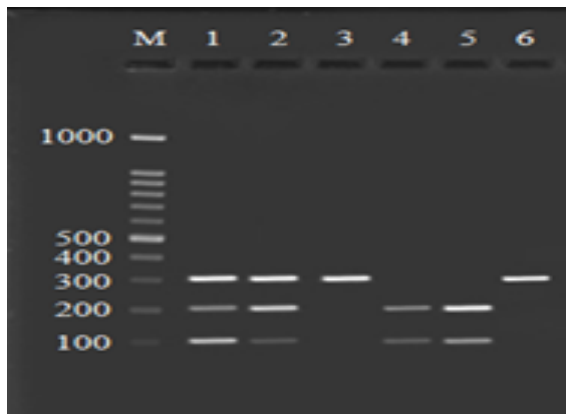
شکل ۳: نتایج هضم آنزیمی و مشاهده قطعات برش خورده توسط آنزیم AclI بر روی ژل آگارز ۲٪.

الکتروفورز مورد رانش قرار گرفته و باندهای ایجاد شده با نور ماورای بنفش مشاهده و با دستگاه ژل داکيومنتیشن عکسبرداری و ثبت گردیدند (شکل ۳).