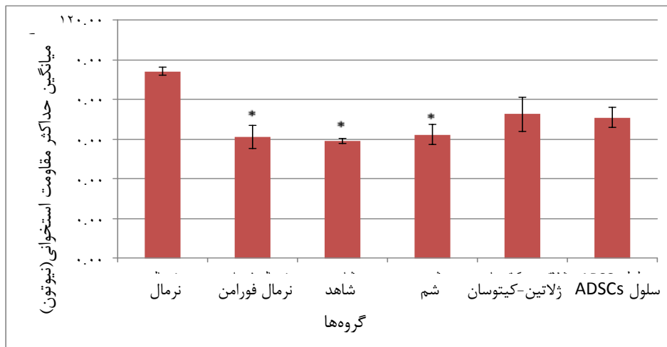
نمودار ۲: میانگین حداکثر مقاومت استخوانی Fmax در گروه‌های مختلف چهار هفته بعد از پیوند *اختلاف معنی‌دار با گروه نرمال ( p < 0.05 )