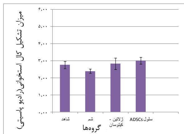
نمودار ۱: مقایسه میانگین میزان تشکیل کال استخوانی (رادیوپااسیتی) چهار هفته بعد از پیوند در گروه‌های مورد مطالعه

نتایج بررسی‌های رادیوگرافی چهار هفته بعد از پیوند سلول نشان داد میانگین میزان تشکیل کال استخوانی (میزان رادیوپااسیتی) در محل ایجاد نقص استخوانی در گروه شاهد ( 2/7 \pm 0/214 )، گروه شم ( 2/39 \pm 0/130 )، گروه غشاء ( 2/83 \pm 0/33 ) و گروه سلول درمانی ( 3/0 \pm 0/204 ) بود. دو گروه شاهد و شم از نظر میانگین کال استخوانی و نفوذ اشعه x (رادیوپااسیتی Radio opacity) اختلاف معنی‌داری نداشتند.