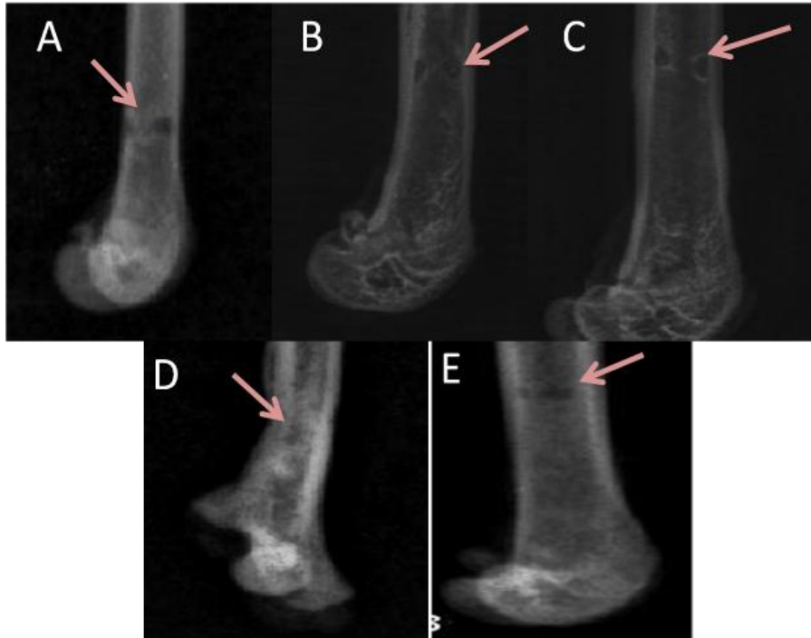
شکل ۲: تصاویر رادیوگرافی با نمای قدامی - خلفی (Ant-Post) و نمای جانبی (Lat) از محل تشکیل کال استخوانی در گروه‌های مختلف. پیکان‌ها محل کال استخوانی را در حیوانات نرمال فورامن (A)، شاهد (B)، شم (C)، غشاء (D) و سلول درمانی (E) نشان می‌دهد.

بررسی تصاویر رادیوگرافی استخوان‌های فمور در گروه‌های کنترل، شم، پیوند غشاء و سلول نشان داد که میزان تشکیل