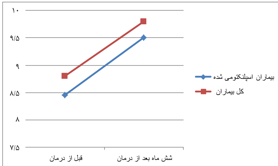
نمودار ۳: تغییرات میانگین هموگلوبین در کل بیماران و اسپلنکتومی شده

از بین بیماران مورد مطالعه ۹ نفر (۱۴/۲۸٪) اسپلنکتومی شده بودند که در پایان ۶ ماه درمان با هیدروکسی اوره، ۷ نفر (۷۷/۷۷٪) به طور کامل از تزریق خون بی نیاز شده و ۲ نفر (۲۲/۲۲٪) افزایش فواصل تزریق خون به بیش از یک ماه را داشته اند. در پایان ۶ ماه درمان با هیدروکسی اوره، میانگین هموگلوبین کل بیماران افزایش معنی‌دار و میانگین فریتین کل