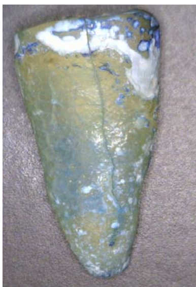
شکل ۲: شکستگی ایجاد شده در یک نمونه از گروه ۲