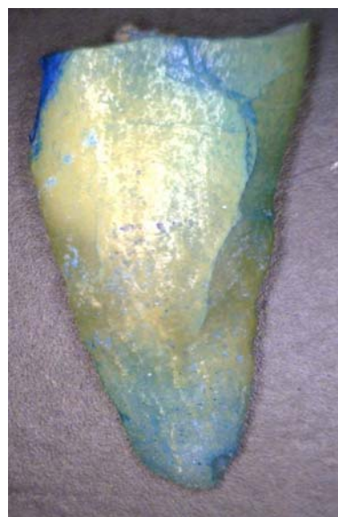
شکل ۱: شکستگی ایجاد شده در یک نمونه از گروه ۱