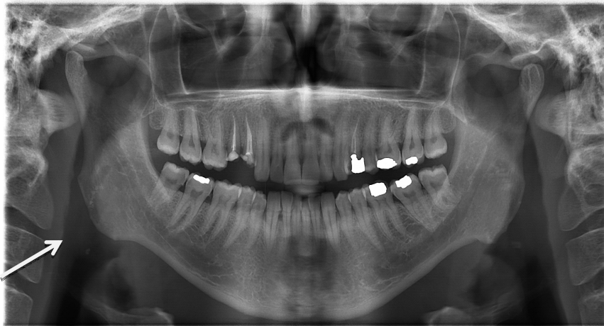
تصویر ۱: یک نمونه کلیشه پانورامیک با تصویر واضحی از تونسیلولیت

بزرگنمایی در اندازه‌گیری‌ها محاسبه شد. نسخه ۱۷ و آزمون آماری Chi-square, Fisher exact test و سپس داده‌های جمع‌آوری شده با استفاده از نرم‌افزار SPSS Odds Ratio مورد تجزیه و تحلیل قرار گرفت.