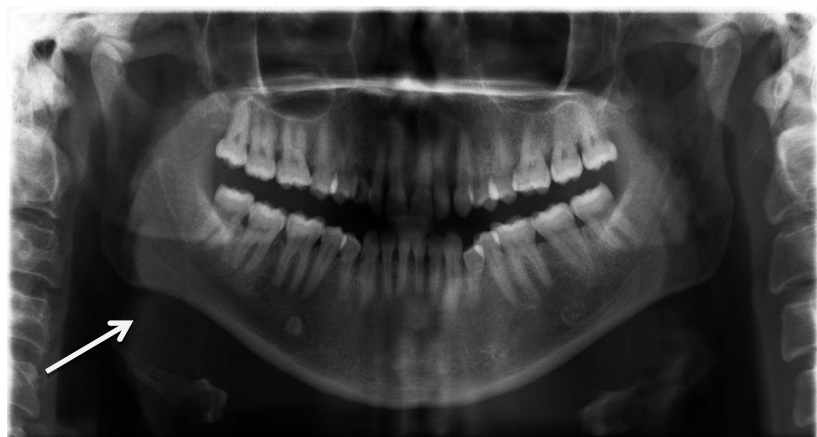
تصویر ۲: یک نمونه کلیشه ی پانورامیک با تصویر واضحی از سنگ غده بزاقی تحت فکی