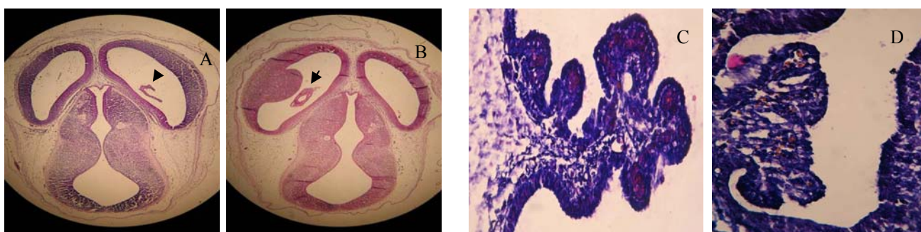
تصویر ۱: شبکه کوروئید بطن‌های جانبی مغز در جنین‌های ۱۵/۵ روزه

سطح گلوکز خون مادران نرمال ۸۰ \pm ۱۵ میلی‌گرم/دسی‌لیتر و مادران دیابتی ۲۰۰ \pm ۱۸ میلی‌گرم/دسی‌لیتر بود. با اندازه‌گیری حجم شبکه کوروئید در بطن‌های جانبی مغز، مشاهده گردید میانگین حجم شبکه کوروئید بطن‌های جانبی جنین‌های حاصل از مادران دیابتی ۰/۰۷۴۲ \pm ۰/۰۰۹ میلی‌متر مکعب بوده و نسبت به میانگین حجم شبکه کوروئید در جنین‌های گروه کنترل که معادل ۰/۰۲۹ \pm ۰/۰۰۹ میلی‌متر مکعب بود افزایش معناداری داشت ( p < ۰/۰۵ ) (نمودار ۱).