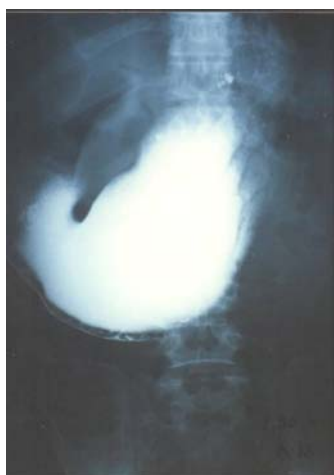
شکل (۳): مشاهده حباب های هوا ساب سروزال معده

طبیعی اپی تلیوم گزارش شد. بیمار به عنوان یک PCI ایدیوپاتیک تحت نظر قرار گرفت.