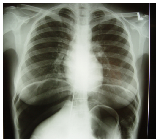
شکل (۱): مشاهده هوای آزاد زیر دیافراگم در بیمار مبتلا به PCI