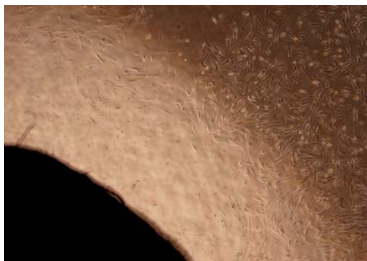
شکل (۳): سیتوتوکسیسیته درجه دو

شده توسط سلولها از MTT جایگزین گردید و پس از پیتینگ، پلیتها توسط الیزاریدر (هایپرین ساخت آمریکا) در طول موج ۴۹۲-۶۳۰ نانومتر خوانده شد و درصد بقای سلولی نسبت به گروه کنترل و نمودار شیب گرادینت نسبت به ایزوربانس مشخص گردید. شیب غلظت سلولی نسبت به ایزوربانس با استفاده از فرمول (۹۴+ تعداد سلول \times 0.172 ): ایزوربانس) محاسبه گردید که از طریق آن نسبت سلولهای زنده در هر خانه پلیت ۹۶ خانه مشخص گردید (نمودار ۱) سپس داده ها به نرم افزار آماری SPSS داده شد. جهت مقایسه سازگاری نسجی بین گروهها از آزمون Kruskal-Wallis و برای مقایسه هر دو گروه با یکدیگر و گروه کنترل از آزمون Mann-Witney استفاده گردید. در بیان نتایج، مقادیر P.Value کمتر از ۰/۵۰ معنی دار در نظر گرفته شد.