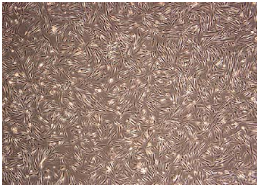
شکل (۱): سیتوتوکسیسیته درجه صفر