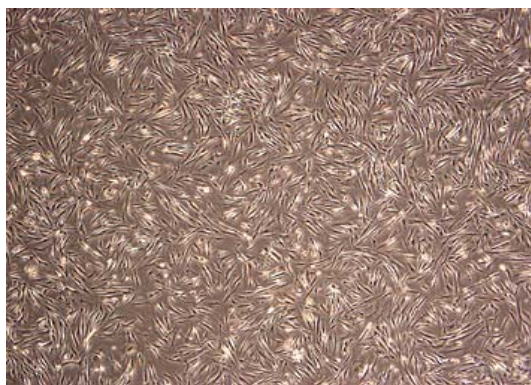
شکل (۱): سیتوتوکسیسیته درجه صفر