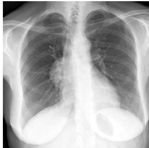
شکل (۱): گرافی ساده قفسه صدی

دوهفته بعد از عمل ابتدا بیمار دچار پارستزی اندام ها و بعد از آن ضعف اندامها که ابتدا از اندام های تحتانی شروع و ظرف ۴۸ ساعت اندام های فوقانی و عضلات تنفسی را مبتلا نمود . وی قادر به بستن چشمها نبود . بیمار جهت بررسی بیشتر بستری شد. ظرف چند ساعت از پذیرش بیمار دچار نارسایی تنفسی شد . آنالیز گازهای خون شریانی بدون دریافت اکسیژن در آن زمان : HCO_3^- = 24 ، PO_2 = 45 mmHg ، PCO_2 = 73 mmHg ، PH = 7.15 meq/l و O_2Sat = 70\% بود. بلافاصله بیمار به ICU منتقل، انتوبه و به ونتیلاتور متصل شد. با شک به میاستنی گراویس پلاسما فرز روزانه ۱/۵ لیتر برای بیمار شروع شد. ظرف ۴ روز بیمار از ونتیلاتور جدا و اکستوبه شد. در معاینه نورولوژیک بعد از جدا شدن از ونتیلاتور علی رغم بهبودی تنفسی و نرمال بودن هوشیاری بیمار دچار فلج فاسیال دو طرفه بود، رفلکسهای تاندونی اندام های تحتانی از بین رفته و رفلکسهای تاندونی اندام های فوقانی کاهش یافته بودند . رفلکس جلدی شکمی و رفلکس های پلاتنار نرمال بودند. قدرت عضلانی در ناحیه دیستال و پروگزیمال اندامهای تحتانی سه پنجم و قدرت عضلانی در دیستال و پروگزیمال اندامهای فوقانی چهارپنجم بود . سطح حسی وجود نداشت. اختلال حس های ارتعاش و موقعیت در اندامهای تحتانی و اختلال حسی جورایی در اندامهای تحتانی دیده شد.