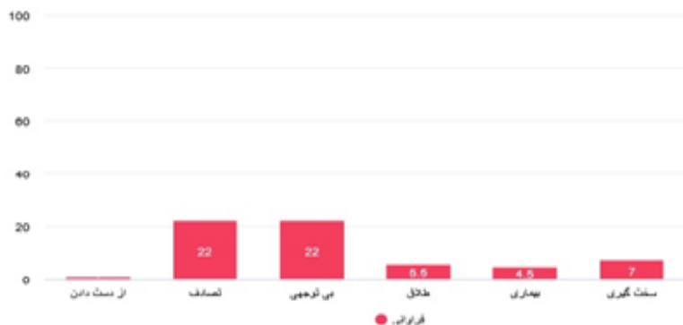
نمودار ۴: فراوانی انواع تروما های کودکی