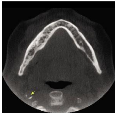
تصویر ۱: کلسیفیکاسیون شریان کاروتید در رادیوگرافی CBCT

محققین تحقیقات نشان داده است که این نابرابری‌ها به دلیل عوامل متعددی از جمله نژاد، پاتوفیزیولوژی بیماری، دسترسی به مراقبت، تبعیض در ارائه خدمات و وضعیت اجتماعی-اقتصادی است (۱۹). در مطالعه دیگری دلیل این نابرابری را به بالاتر بودن بعضی عوامل خطر از جمله کشیدن سیگار در مردان نسبت داده‌اند (۱۷). با توجه به این که شیوع CAC در