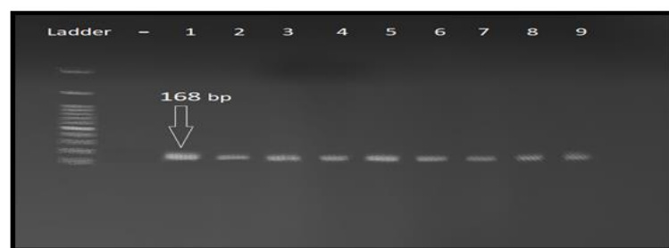
شکل ۳: نتایج حاصل از الکتروفورز نمونه افراد بیمار و سالم (مشابه بود) RFLP-PCR پلی مورفیسم Visfatin