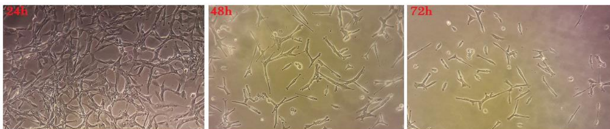
شکل ۱: تاثیر غلظت ۵ میلی گرم / میلی لیتر (غلظتی که سبب کاهش ۵۰ درصدی بقای سلولی گردید) سوپرناتانت لاکتوباسیلوس ساکنی بر رده سلولی MCF-7 برای مدت زمان انکوباسیون ۲۴، ۴۸ و ۷۲ ساعت