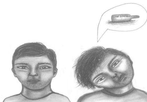
شکل ۱. انحراف عمدی گردن باهدف دریافت داروی تزریقی بایپریدن در اثر شرطی شدن به منظور بالابردن خلق و خو

نیست، بنابراین نمی‌تواند از نوع دیستونی عملکردی باشد. اختلال ساختگی یک اختلال روانپزشکی است که در آن افراد مبتلا به عمد علائم جسمی یا روانی را برای به عهده گرفتن نقش یک بیمار جعل می‌کنند. بدون هیچ سود آشکار بیماران مبتلا به اختلال ساختگی اغلب در بیمارستان بستری می‌شوند و تحت درمان قرار می‌گیرند. بیماران به‌طور فریبنده‌ای علائم بیماری و یا آسیب‌ها را روی خود، حتی در نبود مزایای بیرونی آشکار مانند سود مالی، خانه یا دریافت دارو، شبیه‌سازی و ایجاد می‌کنند (۱۴، ۱۵). اما به دلیل همپوشانی موارد فوق و تغییر علائم بیمار در طی زمان، به‌کارگیری آن‌ها دشوار است. تایید اینکه هدف بیمار از وانمود کردن بیماری دسترسی به دارو می‌باشد، مسئله مهمی جهت تمایز اختلال ساختگی از تمارض