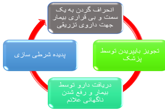
نمودار ۱: شرطی سازی و تقویت مثبت دریافت دارو

سدیم والپروات (۵۰۰ میلی‌گرم هر ۱۲ ساعت)، لیتیم کربنات (۳۰۰ میلی‌گرم هر ۱۲ ساعت)، تیوریدازین (۲۵ میلی‌گرم هر شب) و مدروکسی پروژسترون استات ۵ میلی‌گرم (روزی