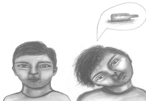
شکل ۱. انحراف عمدی گردن باهدف دریافت داروی تزریقی بایپریدن در اثر شرطی شدن به منظور بالابردن خلق و خو

نیست، بنابراین نمی‌تواند از نوع دیستونی عملکردی باشد. اختلال ساختگی یک اختلال روانپزشکی است که در آن افراد مبتلا به عمد علائم جسمی یا روانی را برای به عهده گرفتن نقش یک بیمار جعل می‌کنند. بدون هیچ سود آشکار بیماران مبتلا به اختلال ساختگی اغلب در بیمارستان بستری می‌شوند و تحت درمان قرار می‌گیرند. بیماران به‌طور فریبنده‌ای علائم بیماری و یا آسیب‌ها را روی خود، حتی در نبود مزایای بیرونی آشکار مانند سود مالی، خانه یا دریافت دارو، شبیه‌سازی و ایجاد می‌کنند (۱۴، ۱۵). اما به دلیل همپوشانی موارد فوق و تغییر علائم بیمار در طی زمان، به‌کارگیری آن‌ها دشوار است. تایید اینکه هدف بیمار از وانمود کردن بیماری دسترسی به دارو می‌باشد، مسئله مهمی جهت تمایز اختلال ساختگی از تمارض