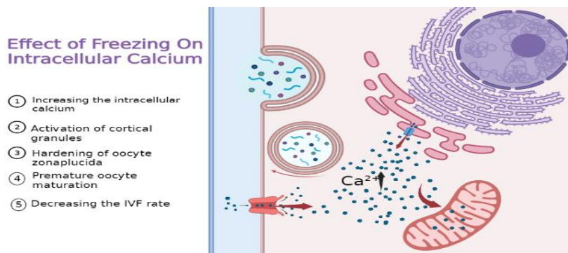
شکل ۲: اثر انجماد بر کلسیم داخل سلولی تخمک و آسیب ناشی از آن.

شده که در نتیجه آن میتوکندری نمی‌تواند ROS کافی را برای تشکیل رشته‌های دوک ارائه کند که منجر به خطایی در تشکیل رشته‌های دوک می‌شود. انجماد تخمک می‌تواند باعث بهم خوردن تعادل اکسایش و کاهش سلول شده، تولیدات ROS را افزایش داده و منجر به کاهش پتانسیل رشد تخمک‌ها پس از ذوب شود (۲۲). با توجه به اینکه از تولیدکننده‌های اصلی ROS زنجیره تنفسی است، افزایش ROS می‌تواند موجب اختلال در این زنجیره شود (۲۳، ۲۴). در مطالعه‌ای که روی انجماد شیشه‌ای تخمک‌های بالغ صورت گرفت مشاهده شد که انجماد با افزایش تولید ROS باعث کاهش تعداد کپی‌های mt_DNA و فعالیت سیتوکروم اکسیداز میتوکندری شد و در ادامه، روی رشد جنین‌ها اثر گذاشت (۲۵).