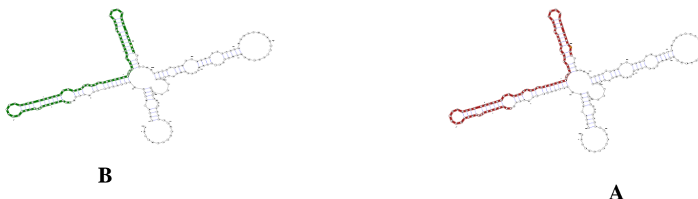
شکل ۳: تغییرات ساختار فضایی ناشی از چندشکلی rs12602273 ژن

* T1≤2cm, T2: 2-5cm, T3> 5cm, ** N0: 0, N1: 1-3cm, N2: 4-9cm, N3≥ 10cm