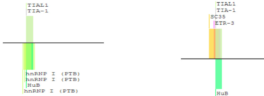
شکل ۴: آنالیز چندشکلی ژن TP53 توسط نرم‌افزار آنلاین Splice Aid2 (A: عدم اتصال دو پروتئین SC35 و ETR-3؛ B: اتصال دو پروتئین SC35 و ETR-3).