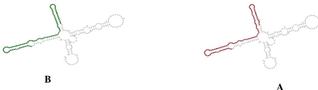
شکل ۳: تغییرات ساختار فضایی ناشی از چندشکلی rs12602273 ژن

* T1≤ 2cm, T2: 2-5cm, T3> 5cm, ** N0: 0, N1: 1-3cm, N2: 4-9cm, N3≥ 10cm