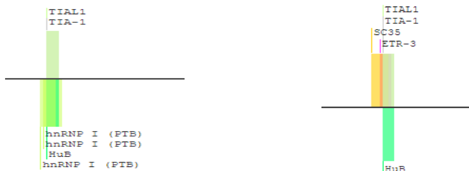
شکل ۴: آنالیز چندشکلی ژن TP53 توسط نرم‌افزار آنلاین Splice Aid2 A: عدم اتصال دو پروتئین SC35 و ETR-3؛ B: اتصال دو پروتئین SC35 و ETR-3.