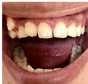
شکل ۱: تصویر فوتوگرافی داخل دهانی با نمای قدامی که بی‌نظمی دندانی را نشان می‌دهد.

پانورامیک بیمار وجود یک کانین اضافی را بین دندان لترال و سانترال فک بالا نشان می‌دهد (شکل ۳). علاوه بر این، تمام کواردانت‌های فکی بررسی شدند و هیچ جابه‌جایی یا دندان‌های اضافی با موقعیت‌های کاملاً طبیعی را نشان ندادند. بر اساس رادیوگرافی پری‌آپیکال داخل دهانی، یک دندان کانین با ریشه بلند بین دندان لترال و سانترال فک بالا نشان می‌دهد (شکل ۴). دندان اضافه کانین، بین دندان لترال و سانترال فک بالا است که به دلیل شکل نامناسب تاج و عرض کمتر نسبت به کانین اصلی که در موقعیت باکالی نسبت به قوس فکی بود. به علاوه که دندانی کانین اصلی آخرین دندانی بوده که در قوس فکی رویش پیدا کرده و موقعیت باکالی دارد. در این بیمار، وجود دندان کانین شیری باقی‌مانده، دندان لترال میخی شکل (Peg shape) و دندان اضافی را می‌توان از عوامل مستعد کننده برای پدیده آنومالی جابه‌جایی در نظر گرفت (۸). بیمار