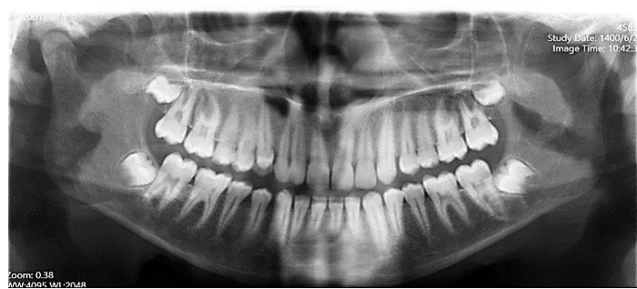
شکل ۳: تصویر رادیوگرافی پانورامیک بیمار دندان کانین اضافه را همراه با جابه‌جایی با لترال را در ناحیه راست فک بالا نشان می‌دهد.