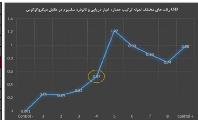
نمودار 2: OD رقت های مختلف نمونه ترکیب عصاره خیار دریایی و نانوذره سلنیوم در مقابل میکروکوکوس