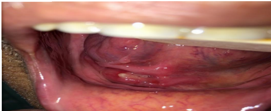
شکل ۲: ترشح چرک و التهاب از مدخل مجرای وارتون سمت راست