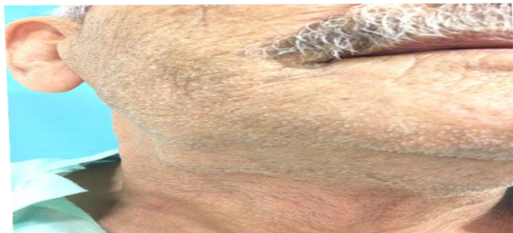
شکل ۱: تورم در ناحیه ساب مندیبلار راست

شده است. در استفاده از کتب و منابع مختلف مثل ترجمه متون یا مقالات رعایت حقوق ادبی و اصول اخلاقی در نظر گرفته شده است. با تصویب طرح در کمیته اخلاق و کسب کد اخلاقی، انجام این پژوهش صورت گرفته است. رضایت آگاهانه و داوطلبانه و کتبی (تمایل به تکمیل پرسشنامهها به عنوان رضایت ضمنی شرکت در مطالعه در نظر گرفته شده، مگر اینکه با