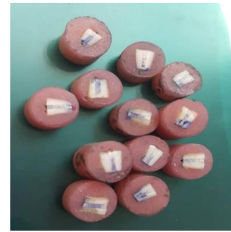
شکل ۳: نمونه‌های مانت شده جهت انجام تست میکروهاردنس

جدول ۱: تعیین و مقایسه میانگین نمره microhardness در گروه‌های ۲و۱