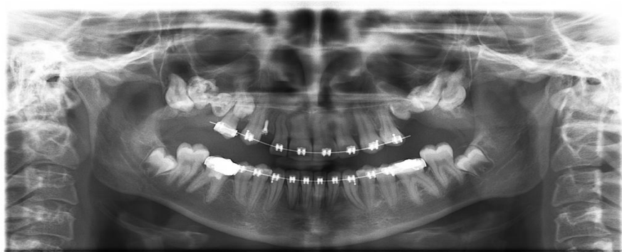
شکل ۳: ادونتوما در خلف سمت راست ماگزایلا و دایلسریشن ریشه در دندان های لترال سمت راست ماگزایلا، کانین سمت چپ مندیبل و پرمولر دوم سمت راست مندیبل مشاهده می‌شود