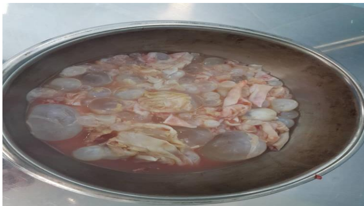
تصویر ۱: کیست‌های هیداتید متعدد داخل شکمی که به دنبال لاپاراتومی خارج شدند

بیمار آقای ۲۵ ساله‌ای است که با سابقه cerebral pulsary از دوران بچگی مراجعه داشته است. درد بیمار در ناحیه LUQ (Left upper quadrant) (بوده که از یک ماه قبل شروع شده و