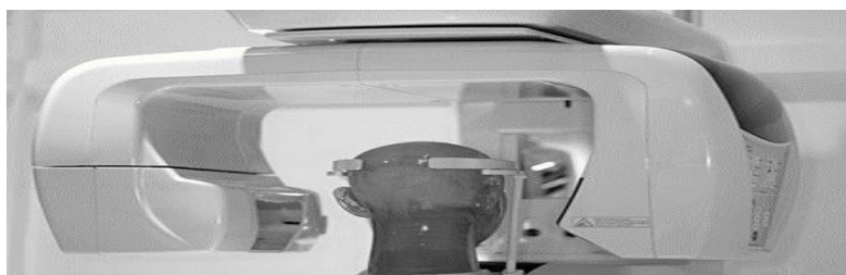
شکل ۳: سیستم ترموگرافی کامپیوتری با بیم مخروطی به همراه فانتوم سر و گردن

می‌دهد. قرص‌های TLD که در دوزیمتری CBCT نیز استفاده می‌شوند، اغلب از ترکیب LiF ساخته شده و مزیت این TLDها این است که ترکیبی معادل بافت دارند و در نتیجه دوز جذب شده توسط آن‌ها شبیه به دوز بافت می‌باشد. این دوزیمترها محدوده ۱ میلی‌گری تا ۱۰ گری را اندازه‌گیری می‌کنند. TLD معمولاً دوز ناشی از ذرات X و بتا و گاما را اندازه‌گیری می‌کنند. پس از تابش TLD، خوانش آن را نباید بیشتر از چند روز عقب انداخت زیرا سیگنال ایجاد شده ضعیف شده و انرژی نهفته به مرور زمان آزاد می‌شود (۲۱، ۲۰).