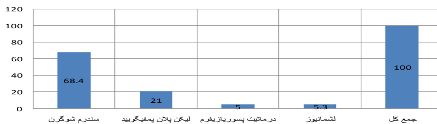
نمودار ۳: درصد توزیع فراوانی انواع آسیب های التهابی