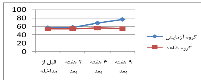
نمودار ۱: نمره کل کیفیت زندگی در چهار وهله زمانی در دو گروه کنترل و آزمایش