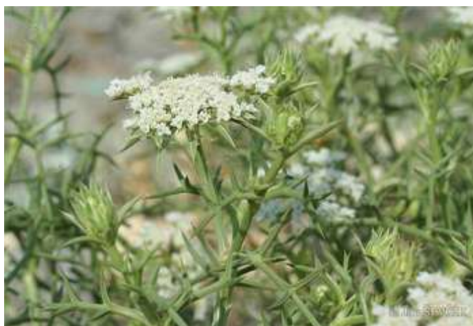
شکل ۱: بخش‌های هوایی گیاه خوشاریزه ( Echinophora platyloba )

گیاه دارویی خوشاریزه با نام علمی Echinophora platyloba از خانواده آپیاسه و دارای ۴ گونه بومی در ایران است که شامل E. Echinophora platyloba ، E. sibthorpiana ، E. orientalis می‌باشد و در فارسی خوشاریزه، خوشاروزه، تیغ توراغ و کشندر نامیده می‌شود (شکل ۱).