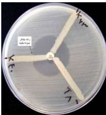
شکل ۱: در تصویر راست، تست فنوتیپی MHT برای تشخیص تولید کرباپنماز: K40، مثبت؛ T8 و K63، منفی.

در تصویر چپ، یافته‌های PCR برای ژن blaVIM : چاهک L، چاهک ۱، کنترل منفی؛ ۲، کنترل مثبت؛ ۳، نمونه منفی؛ ۴، ۵ و ۶، دارای ژن blaVIM